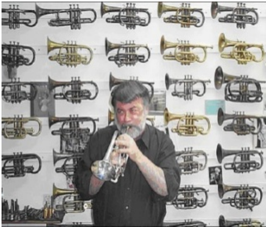
Niles Eldredge con la sua raccolta di cornette

Non sempre i “più darwiniani di Darwin” rendono un buon servizio al pensiero di Darwin: l’eccesso di ricorso a una forma di “darwinismo metodologico” e l’eccessivo uso di analogie tra evoluzione biologica e altri generi di trasformazione provocano, direttamente o indirettamente, un eccesso di resistenza all’intuizione darwiniana e al pensare “darwinianamente”. Un esempio per tutti è l’antievolutionismo che Chomsky, a proposito delle teorie sulla genesi e sullo sviluppo della facoltà linguistica, ha sviluppato – in virtù del suo spiccato anticonvenzionalismo – forse anche come risposta spontanea a un diffuso eccesso di riferimenti al darwinismo nell’interpretazione dell’evoluzione culturale.